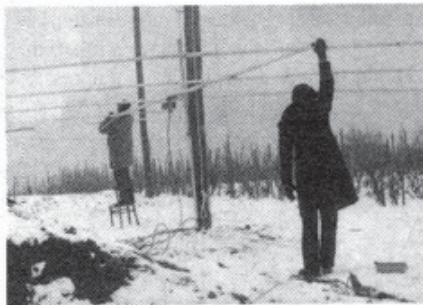
Antene se postavljajo najboljše v snegu ... KLM mora čimprej gor!

Aktivnost in rezultati niso izostali. Mirne duše se lahko pohvalimo, da smo namen in cilj izgradnje opravičili in si v svetu priborili