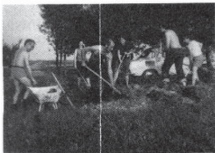
Izkop temeljev ... Radioamaterji znajo vse!

Izgradnjo smo načrtovali v dveh fazah: prva je bila zgradba in notranja ureditev, druga pa ureditev tekmovalnih prostorov z