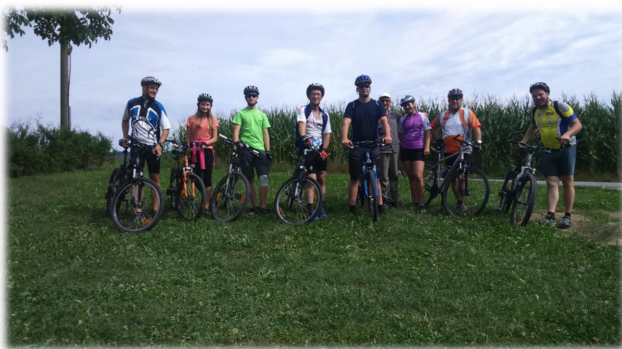
Kolesarji pred začetkom nadaljevanja etape v Bočni