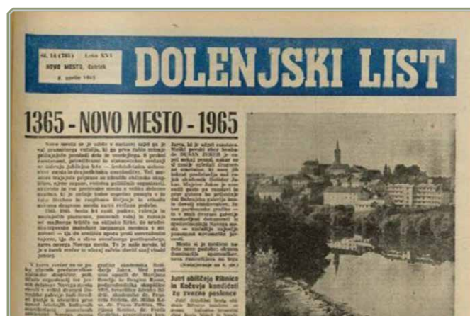
Dolenjski list iz leta 1965